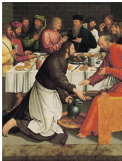
Bernhard Strigel 1460–1521, Deutschland