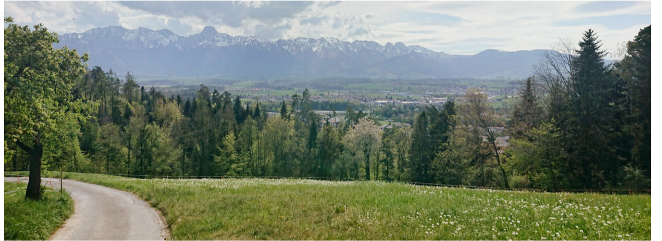
Bild: Foto von einem Spaziergang im Lockdown, jenen Wochen, die bei vielen Raum schafften, Bekanntes aus neuen Blickwinkeln zu betrachten.

Hinzu kommt, dass bei Corona persönliche Erfahrungen mindestens ebenso vielfältig und vielschichtig