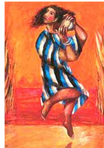
Sieger Köder: Die tanzende Mirjam (Ausschnitt aus Misereor Hungertuch 1996)

Ein Erzählgottesdienst, der Mut, Durchhaltevermögen und Hoffnung vermittelt und der die Zuhörenden berührt und zum Nachdenken anregt.