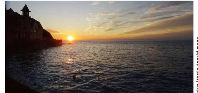
...und bei Flut

Alles hat seine Zeit, alles ist gelenkt. Wir können nichts festhalten. Wenn wir festhalten wollen, erstar- ren wir; erstarrt das Leben. Leben heisst fliessen, heisst werden, sein und vergehen. Leben heisst, die