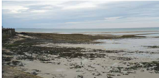
Bucht von Granville bei Ebbe...

Je länger ich den Gezeiten zuge- schaut habe, desto klarer habe ich verstanden, dass es im Leben genau so ist. Wir erleben ständig Gezeiten – in uns, um uns herum, überall.