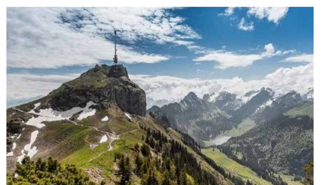
Hoher Kasten mit Drehhotel

Die Seniorenferien 2025 im Kirchentrio finden vom 10. – 13. Juni 2025 in Gais AR statt. Die Ausschreibung finden Sie auf unserer Webseite www.kirche-wichtrach.ch . Auskunft erhalten Sie bei Christina Campolongo, 079 778 98 53 oder ch.campolongo@kirchdorf.ch . Die Teilnehmerzahl ist beschränkt; Anmeldungen werden in der Reihenfolge des Eingangs berücksichtigt.