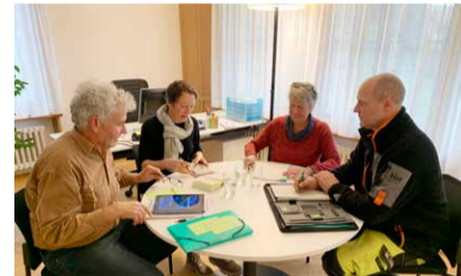
Mir si drannä